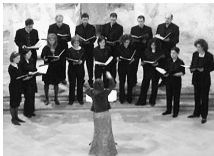
Cappella Musicale San Francesco da Paola

Tutti i concerti di Soli Deo Gloria sono ad ingresso libero ma limitato ai posti disponibili.