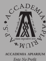
ACCADEMIA APIARIUM Ente No Profit