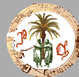
PALMA CHORALIS® Gruppo di Ricerca & Ensemble di Musica Antica