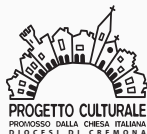
PROGETTO CULTURALE PRODOTTO DALLA CHIESA ITALIANA DIOCESI DI CREMONA