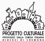
PROGETTO CULTURALE PROMOSSO DALLA CHIESA ITALIANA DIOCESI DI CREMONA